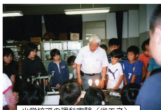
小学校での理科実験（省エネ）