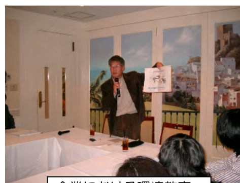
企業における環境教育