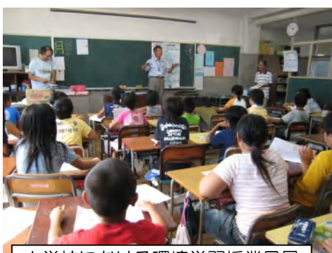
小学校における環境学習授業風景