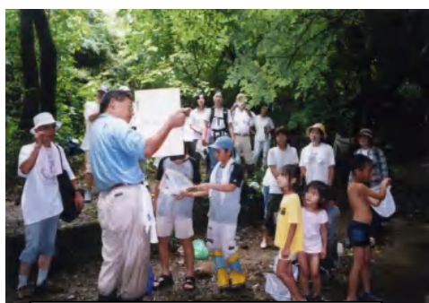
野外（川での）体験学習風景