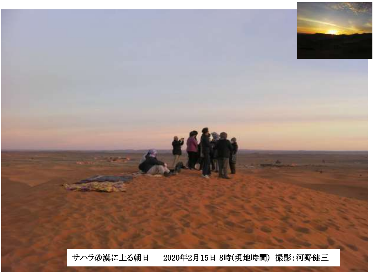
サハラ砂漠に上る朝日 2020年2月15日 8時(現地時間)

サハラ砂漠 5000年前、この広大な砂漠は緑に包まれた大地だった。近年の地球温暖化でサハラ砂漠の面積はさらに広がり、周辺諸国の窮乏に一層の打撃を与えている。